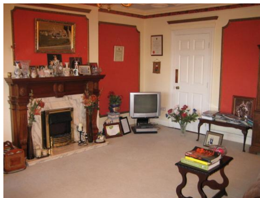
Aamiaishuone / olohuone