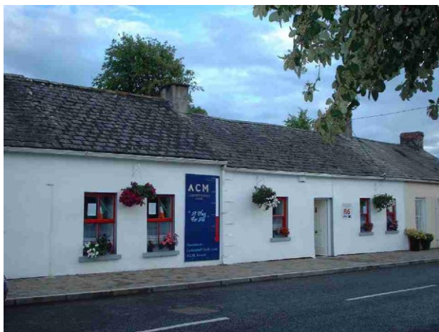
ACM Centren ”kylätalo”