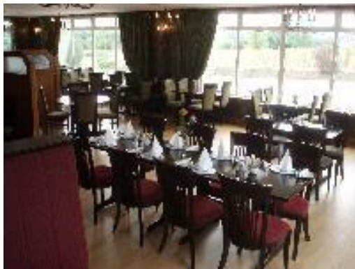
Ruokailutilamme (“kabinetti tai juhlatila”)

Tähän tilaisuuteen olisi kaivattu mukaan paikallisia yrittäjiä joiden kanssa olisi voinut keskustella illallisella. Huomiona käyntikohteessa mm. se, että pikkujouluja markkinoitiin jo (syyskuu). Paikan omistaja/työntekijät olivat voittaneet kahdesti Irish Coffeen valmistamisen ”maailman mestaruuden”. Tämä ei näkynyt mitenkään esim. meidän ruokailussamme; mielestämme jälkiruoaksi olisi täällä sopinut hyvin maailmanmestarin valmistama Irish Coffee. Tällainen pitäisi yrittäjän & jälleenmyyjän osata ehdottomasti hyödyntää tuotekehityksessä ja markkinoinnissa.