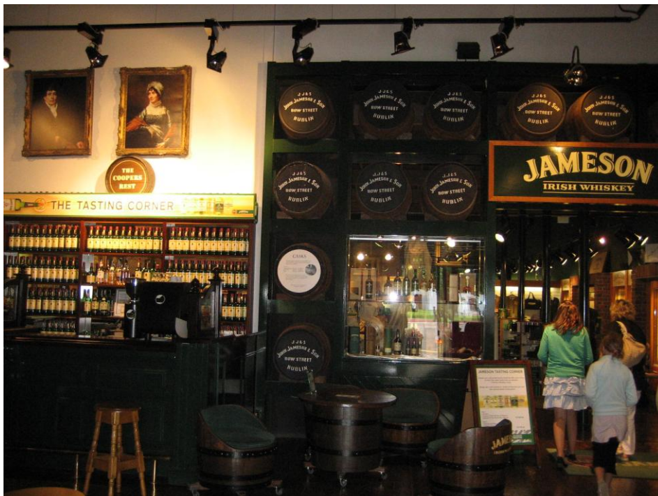
Jamesonin tehtaalta aulatila