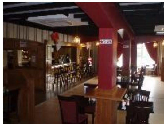
Ravintolasali ja baari